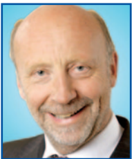
Dieter Posch, Staatsminister Hessisches Ministerium für Wirtschaft, Verkehr und Landesentwicklung