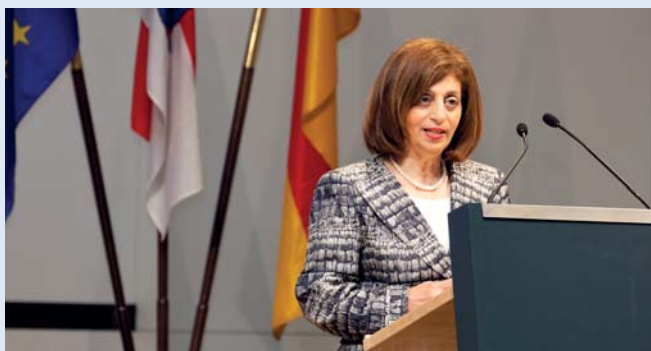
Lenia Samuel, stellvertretende Generaldirektorin für Beschäftigung, Soziales und Integration bei der EU Kommission, spricht über die Herausforderungen des Europäischen Sozialfonds auf Europaebene.